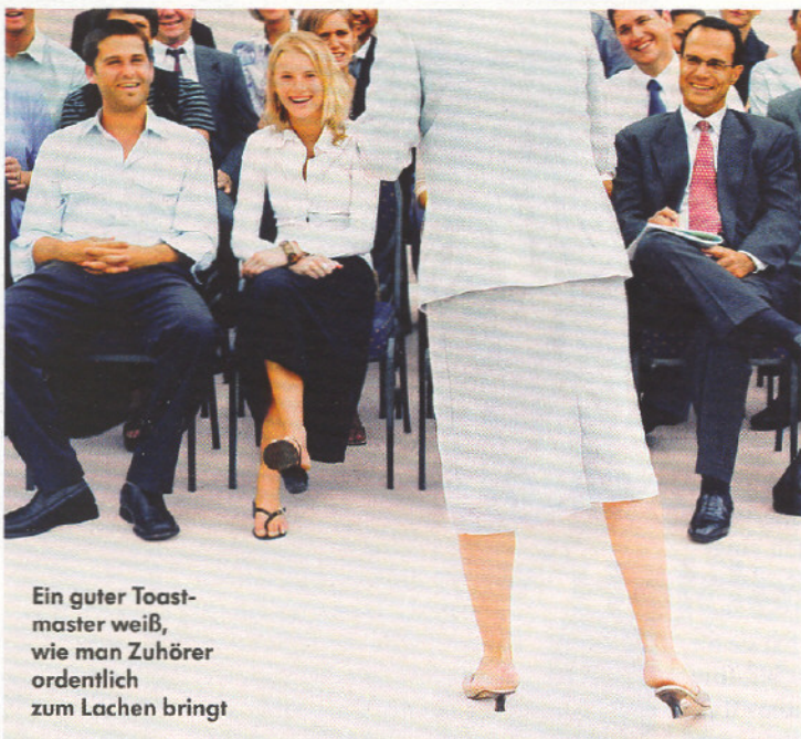
Ein guter Toastmaster weiß, wie man Zuhörer ordentlich zum Lachen bringt

Rhetorik lernen ohne Langleweiligkeit und Englisch sprechen ohne Qual – das sind die Nebeneffekte von „Toastmaster-Treffen“, bei denen es hauptsächlich ums Redenschwingen geht – und zwar ums Redenschwingen mit Vergnügen. Toastmaster-Clubs haben sich mittlerweile weltweit organisiert. In über 9000 Vereinen treffen sich rund 180 000 Mitglieder, zwanzig Vereine gibt es allein in Deutschland: von Berlin bis Ulm. Gesprochen wird meistens Englisch, hin und wieder auch Französisch oder Deutsch. Mitglied werden kann jeder, der Interesse hat, für einen Jahresbeitrag von rund 60 Euro.